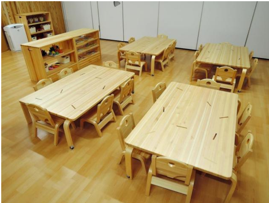
多摩産材製の備品の例

多摩産材製の製品とは、多摩地域で生育し、適正に管理された森林から生産された木材のうち、 多摩産材認証協議会 によって 産地証明された「認証材」 を使用して製作された備品をいう。