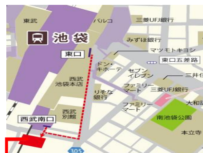
TKPガーデンシティ PREMIUM池袋